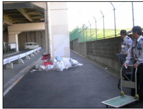
市街地に投棄されたBBQゴミ