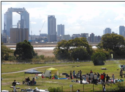
西中島地区のBBQ利用状況

淀川河川公園西中島地区では多くの皆様（平成26年度は公園区域も含み約26万人の方にご利用頂きました。）にバーベキュー（以下BBQ）をお楽しみ頂いております。淀川河川公園ではBBQゴミに限らず、すべてのゴミはお持ち帰り頂いておりますが、西中島地区については、発生した大量のBBQゴミの一部が市街地へ投棄され、近隣住民の皆様のご迷惑となっていることから、チラシの配布等の啓発活動、パトロール等とあわせ、暫定的にゴミ箱を設置している状況です。